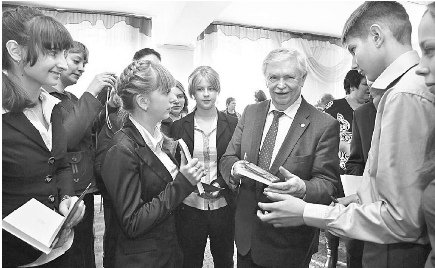
Альберт Лиханов в Грайворонской районной библиотеке

ПОЧЕМУ ЧИТАТЕЛЕЙ ПРОИЗВЕДЕНИЙ АЛЬБЕРТА ЛИХАНОВА МОЖНО НАЗВАТЬ НРАВСТВЕННЫМИ ЛЮДЬМИ