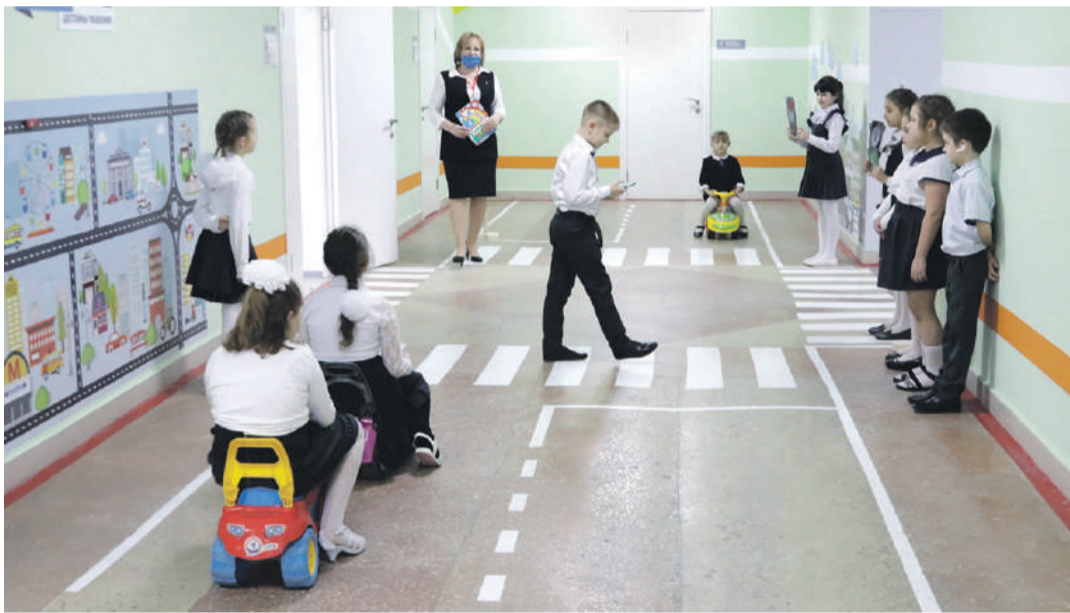
Занятия в образовательной зоне «Правила движения достойны уважения!» в школе № 2

ского творчества. Здесь занимаются и младшие школьники, для которых конструирование роботов — уже привычное дело. Как и для учеников школы с УИОП: в зависимости от возраста детей здесь действует два объединения дополнительного образования — «Робототехника» и «Введение в робототехнику».