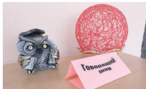
«Говорящий шар» в школе с УИОП. Ученики бросают в него свои отзывы и пожелания