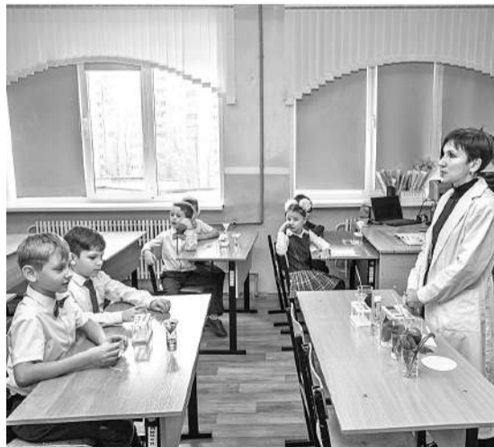
Шуховцы изучают кислотность почв