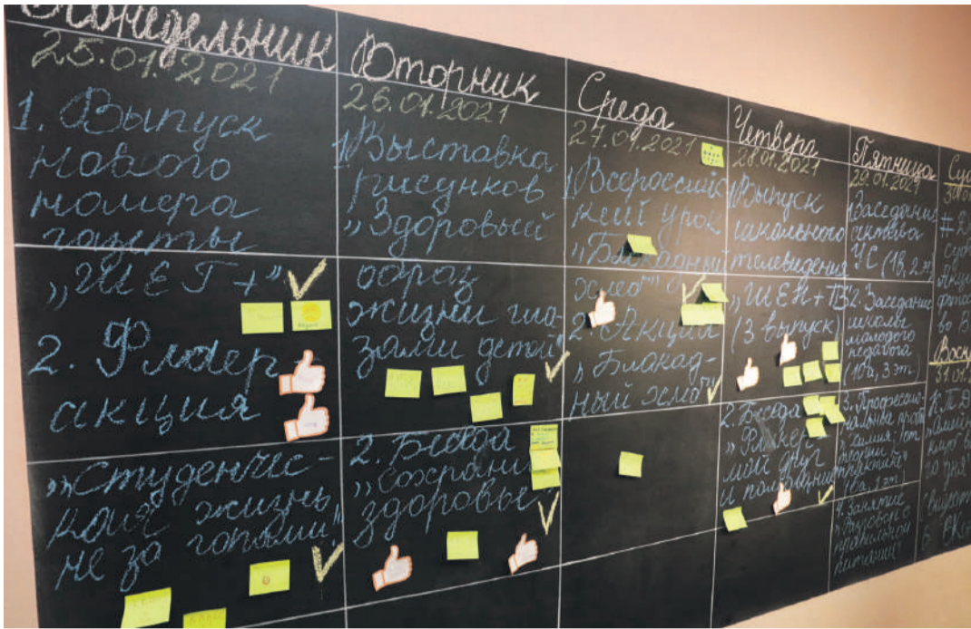
«Говорящая» стена в школе с УИОП