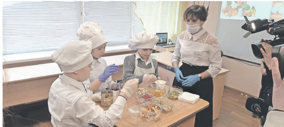
На внеурочке, посвящённой правильному питанию, ученики школы с УИОП готовят вкусные и полезные блюда