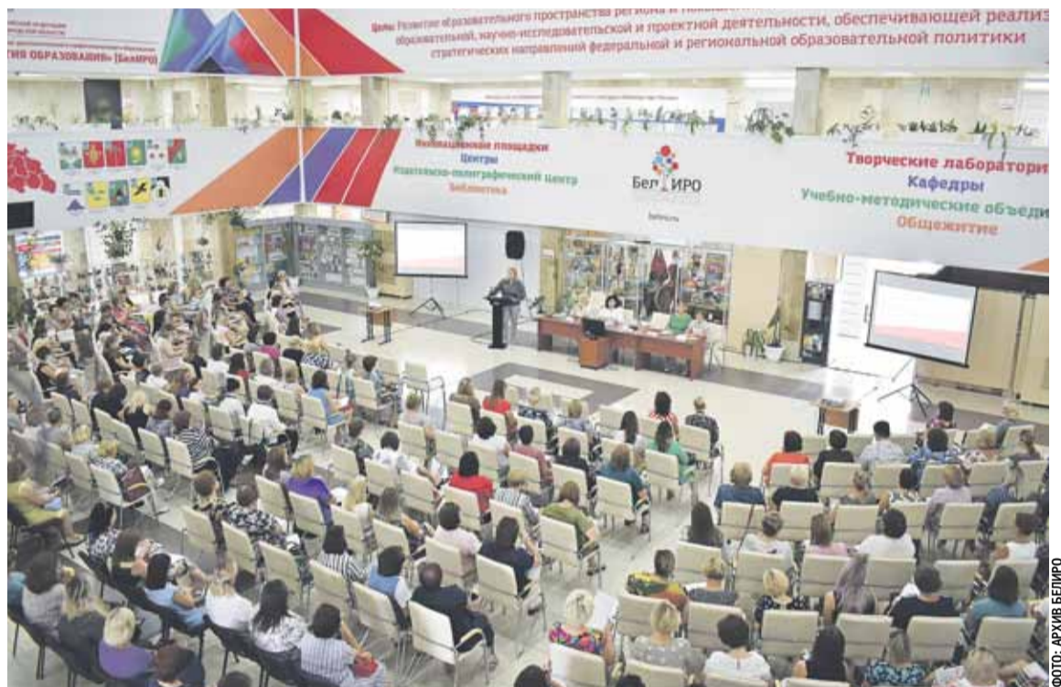
Современный, методически и технологически оснащённый центр непрерывного образования