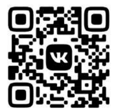
ПАБЛИК В СОЦСЕТИ «ВКОНТАКТЕ» HTTPS://VK.COM/KAFEDRA_DZOT

Созданная группа в соцсети позволит учителям физкультуры оперативно обмениваться лучшими практиками, делиться опытом регионов, конкретных образовательных учреждений.