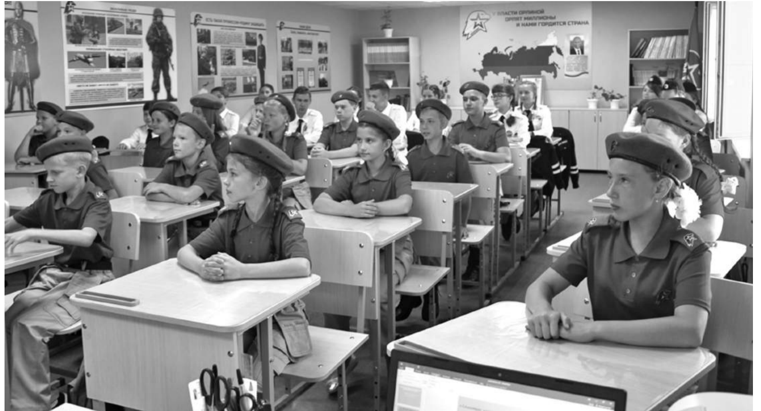
Кадетский класс школы № 1

В результате реализации проекта в школе создали лабораторию, которую можно без преувеличения назвать кузницей пытливых, талантливых юных исследователей. Ученики от четвёртого до выпускного классов занимаются наукой. В рамках постпроектной деятельности рядом с лабораторией оформлена развивающая зона «Химия занимательная и увлекательная», которая рассказывает об опытах,