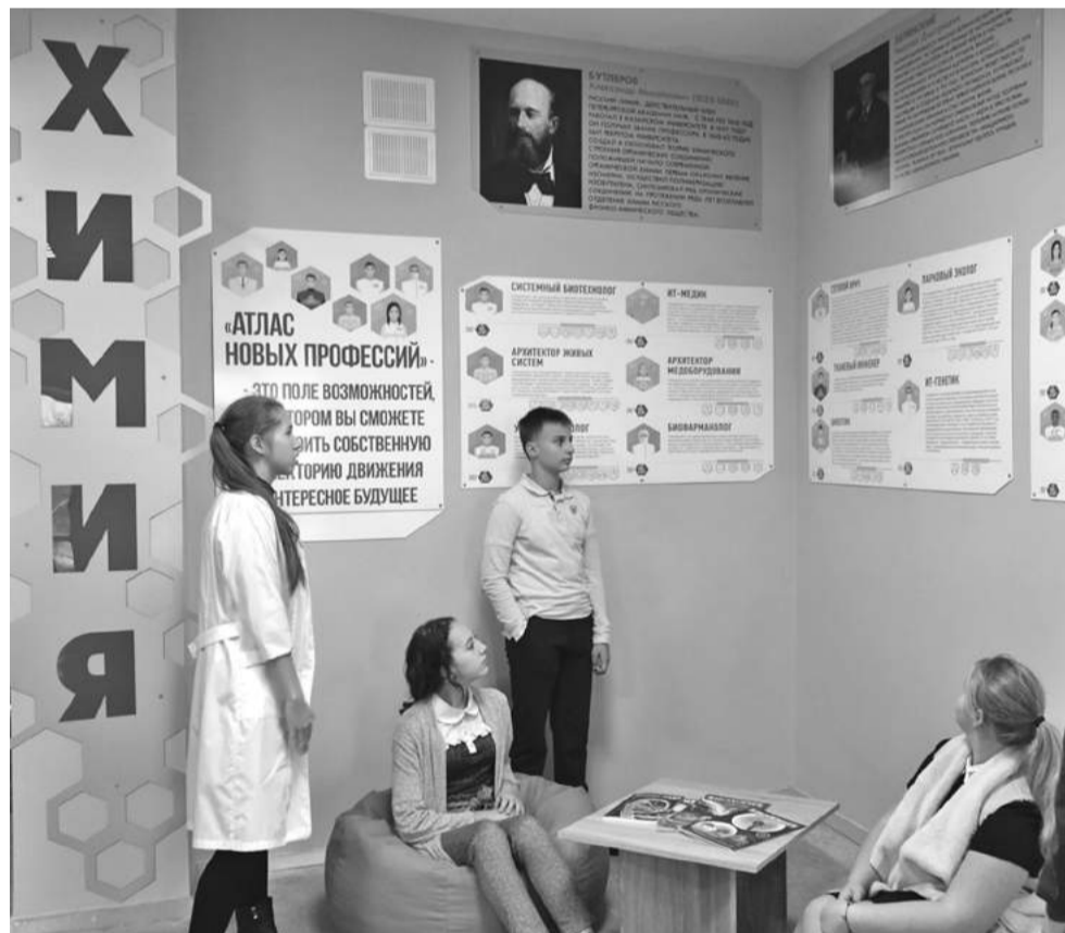
Профориентационная зона в школе № 1