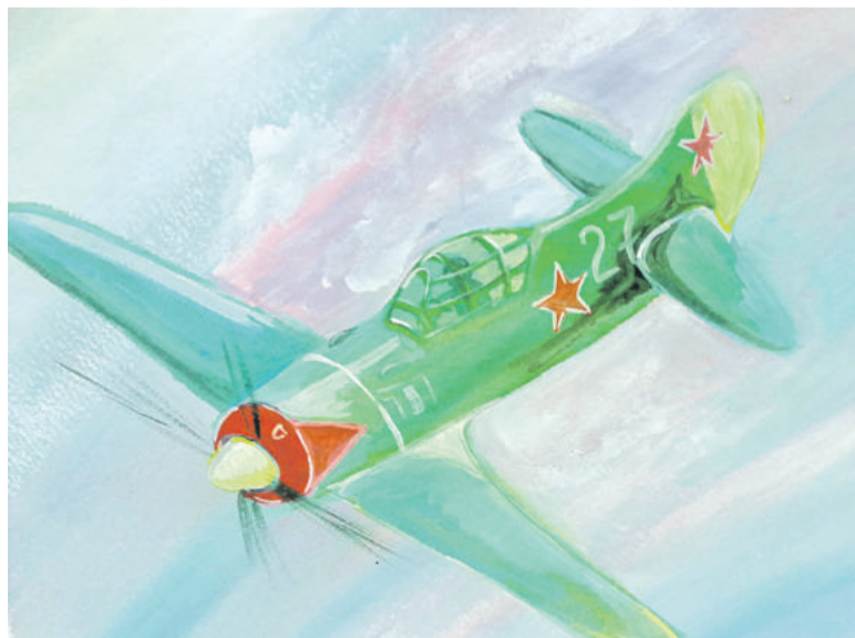
Воздушный бой. Рисунок Дмитрия Новикова (Корочанская школа им. Д. Кромского)