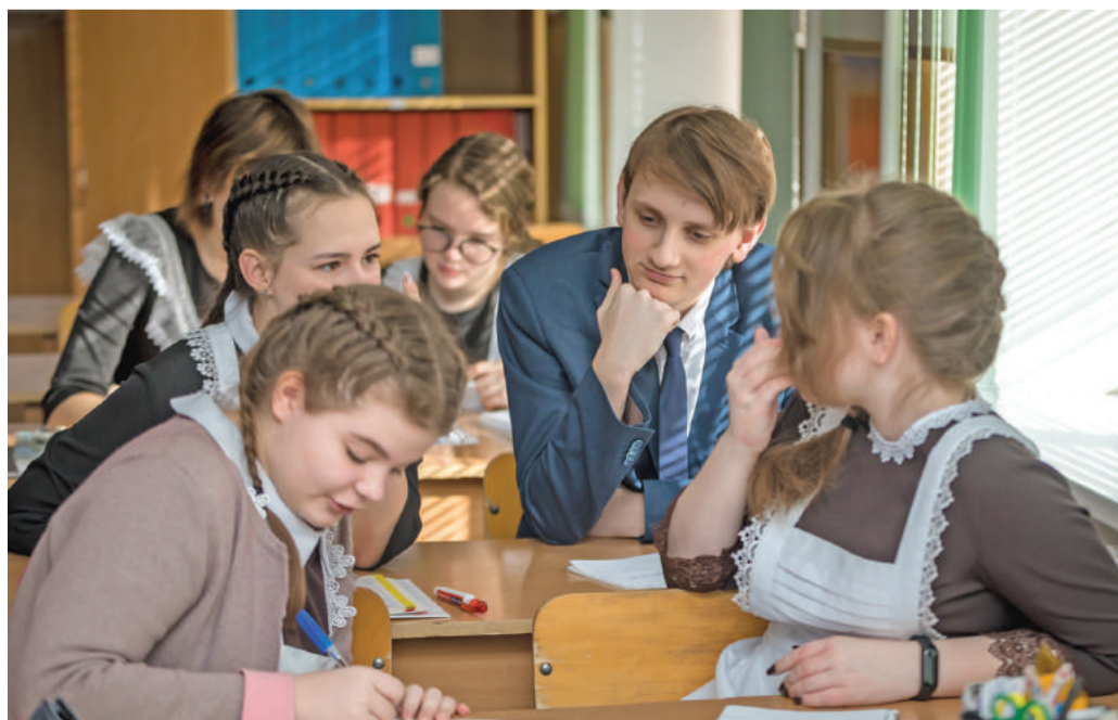
Урок обществознания в 10-м «Б» классе

Ольга МУШТАЕВА » ТЕКСТ