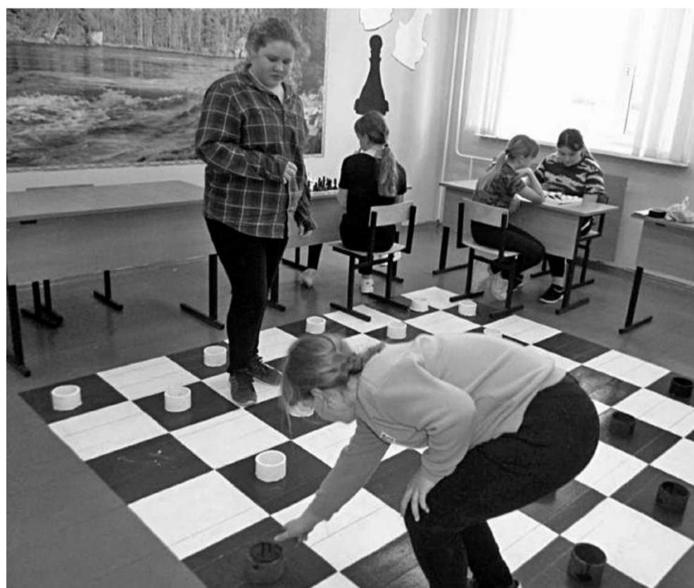
Игровая зона в Глинской школе