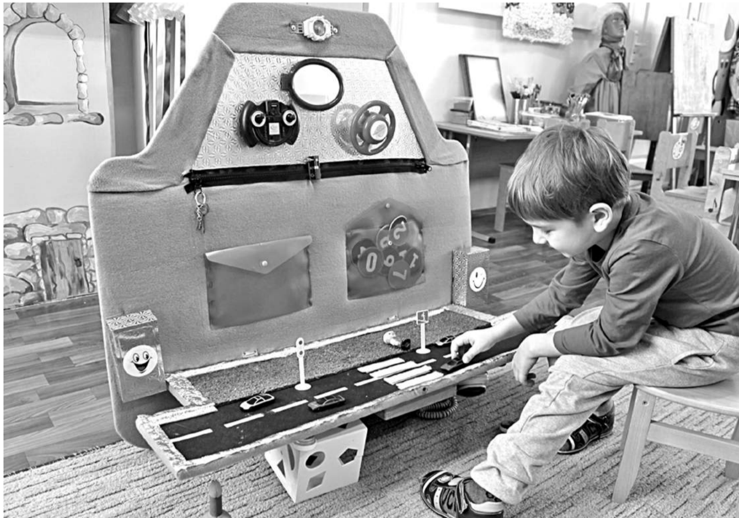
Игровая зона в детском саду № 8

СЕГОДНЯ СВОИМ ОПЫТОМ ДЕЛЯТСЯ УЧРЕЖДЕНИЯ ОБРАЗОВАНИЯ НОВООСКОЛЬСКОГО ГОРОДСКОГО ОКРУГА