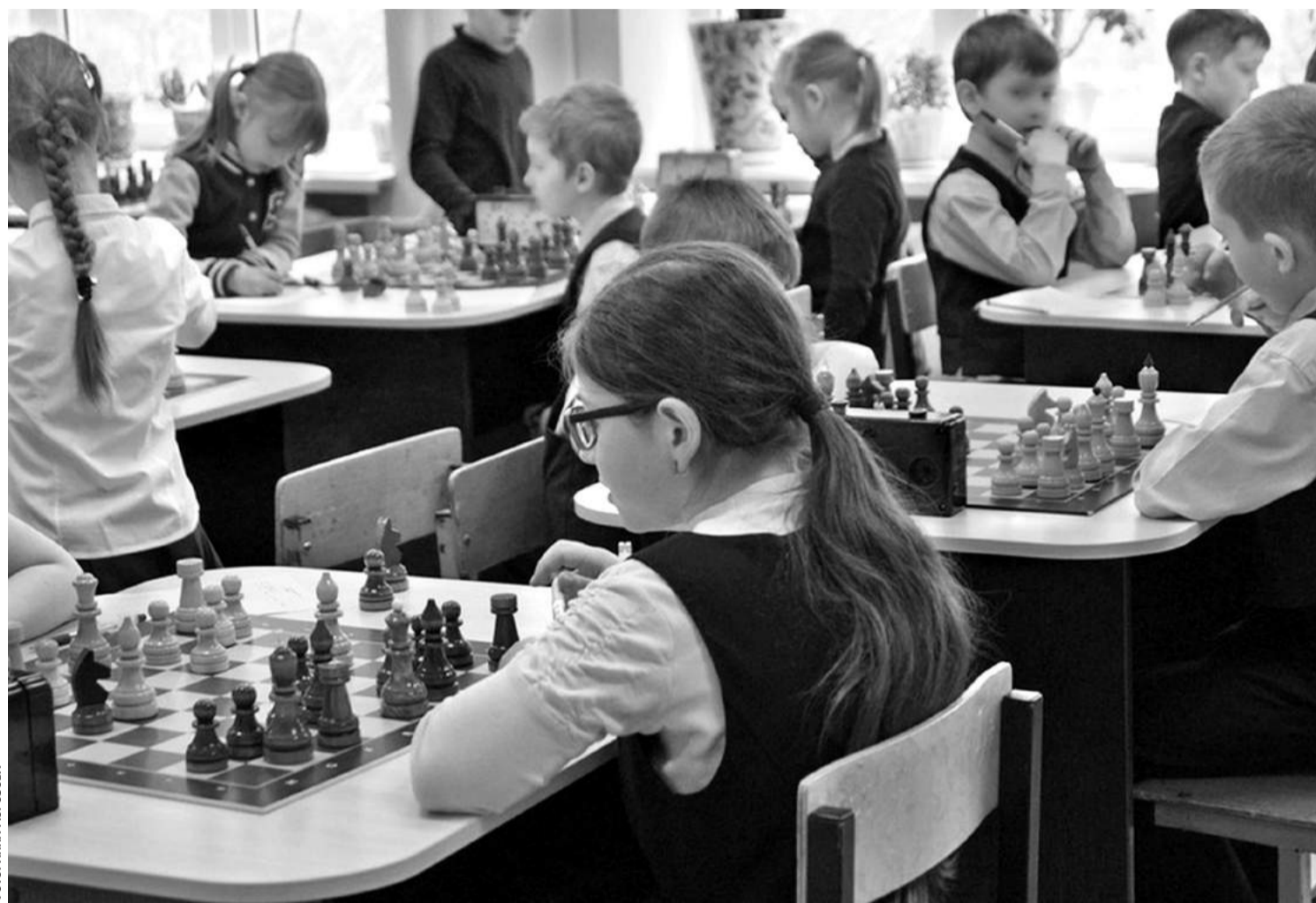
В образовательном комплексе «Луч»

— Высокий уровень локального нормотворчества. В этих учебных заведениях есть хорошо проработанные локальные нормативные акты, которые обеспечивают порядок. Основные образовательные программы и программы развития направлены на активное познание мира, развитие учебно-исследова-