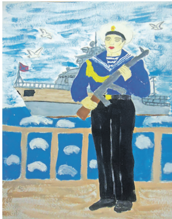
Моряк. Рисунок Анатолия Черняева (Графовская школа Шебекинского горокруга)

Ульяна Самаль, ученица Бессоновской школы Белгородского района