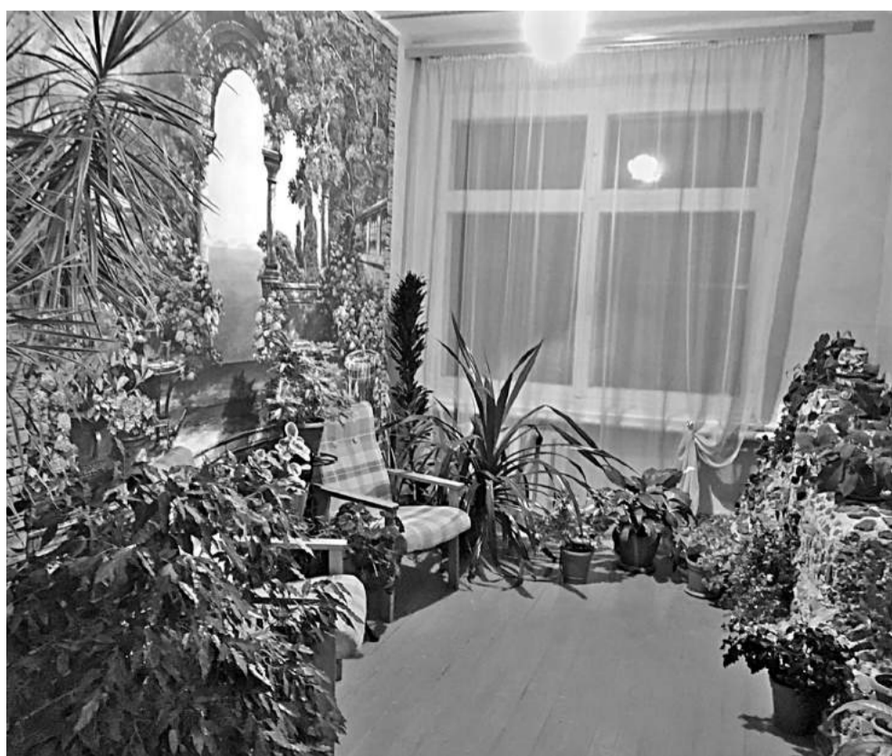
Зимний сад в Васильдольской школе