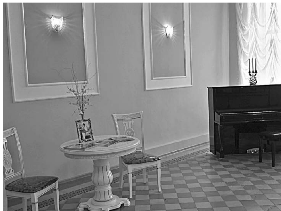
Ольгинский зал школы № 1