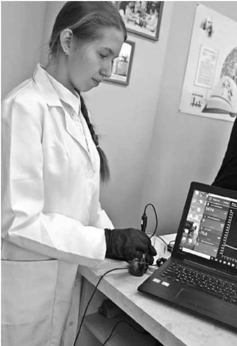
В школе № 1

КОЛЛЕГИ! МЫ ПРИГЛАШАЕМ ВАС СТАТЬ НЕ ТОЛЬКО ЧИТАТЕЛЯМИ, НО И АВТОРАМИ ГАЗЕТЫ!