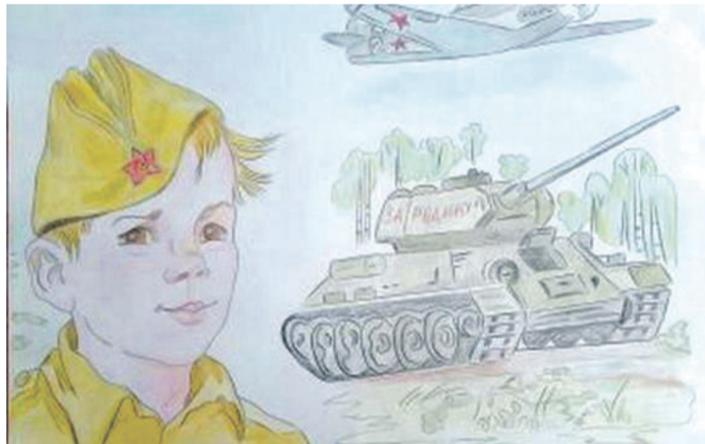
Рисунок Дарьи Лопиной (Корочанская школа им. Д. Кромского)